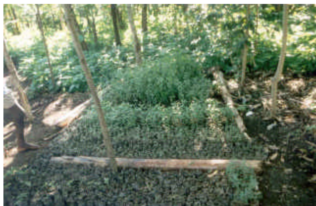
Baumschule des Halasi Naturschutzprojektes