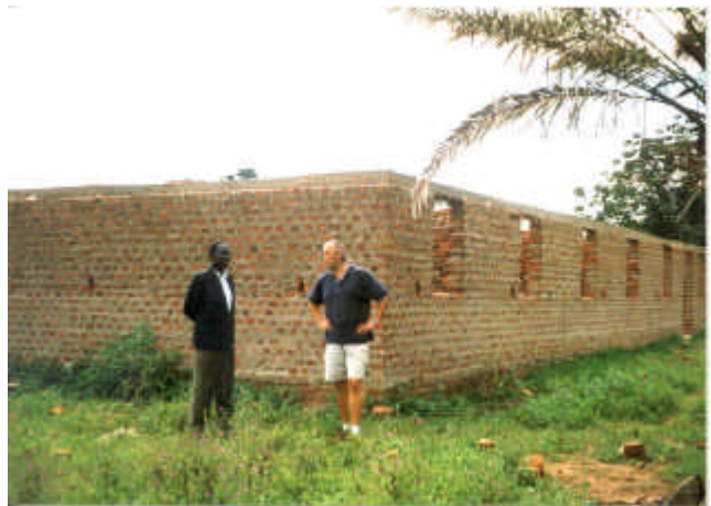
Nagwere Seminarzentrum, Pallisa

Wenn die nächsten Bauphasen auch entsprechend umgesetzt werden, wird das Projekt bald als Seminarzentrum eröffnet werden können. Hierzu stellt sich die Frage, wer sich aus Deutschland für den nächsten Besuch in Pallisa anmelden wird, eventuell zum Richtfest oder Einweihung des Nag-