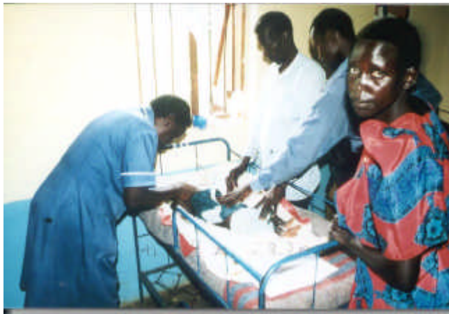
Ein krankes Kind wird im Nagwere helthcenter behandelt